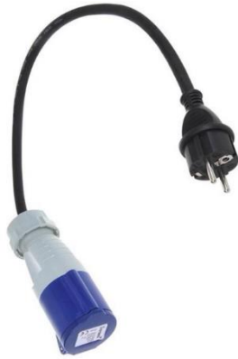
Adapter Schuko Stecker auf CEE Kupplung 1,5 Meter.

Damit kann das Wohnmobil an eine normale Schuko Steckdose angeschlossen werden.