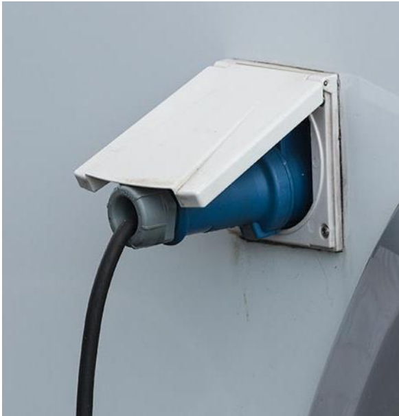
Netzanschluss Dose Beifahrerseite.

Der Stecker ist gegen herausfallen gesichert, blauer Hebel links neben dem Stecker.